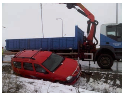
IMÁGENES DEL VEHÍCULO ACCIDENTADO EN EL POLÍGONO DE HONTORIA.

Esta fotodenuncia refleja la imagen de un accidente ocurrido el 16 de marzo, día en el que se produjo una importante nevada. El vehículo, perteneciente a un empresario del Polígono de Hontoria resbaló por la nieve a pesar de ir a una velocidad reduci-