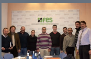
A.E.L.E.H renueva su Junta Directiva Pág. 6-7