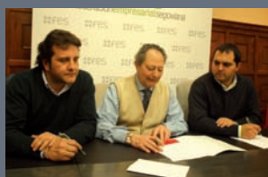
Reunión con los polígonos de Valverde y El Cerro Pág. 8-9