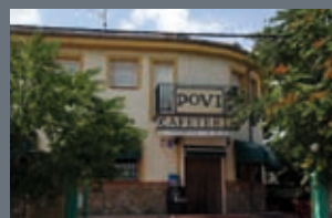
Fallece el fundador de Churrerías Povi Pág. 9