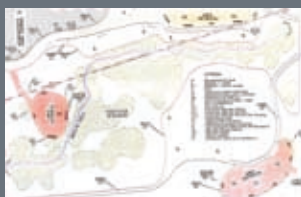
Primer paso para recuperar el Arroyo Vadillo Pág. 6-7