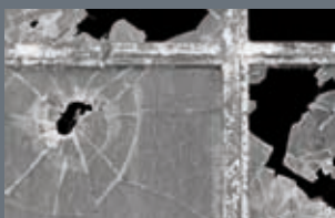
Alertas ante los robos sufridos en el polígono Pág. 4-5