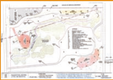
Plano del futuro proyecto de recuperación de la senda del Arroyo Vadillo

fresnos o chopos, y además se colocarán algunos setos. Para proteger el arroyo se utilizará un cerramiento de madera y, para evitar daños en el arbolado, se optará por rollos, también de madera, que envolverán los troncos. El riego por goteo permitirá mantener el nivel de humedad necesario.