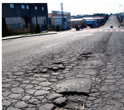
IMAGEM DEL ESTADO DEL PAVIMENTO EN LAS CALLES AVDA. DE HONTORIA Y AVDA. DE SEGOVIA

Esta fotodenuncia refleja la imagen de una de las calles del Polígono de Hontoria cuyo pavimento se encuentra en mal estado. En algunos cruces del área industrial nos encontramos con esta circunstancia, que impide la correcta circulación, ya que los vehículos tienen que frenar y debido a ello se entorpece el tráfico. Así-