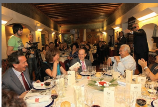
Imagen de archivo del IV Encuentro Empresarial AELEH